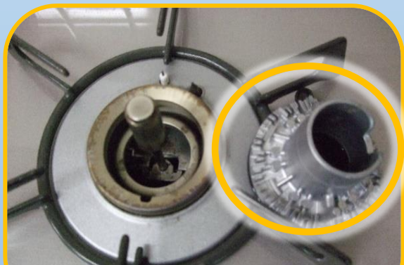
バーナーキャップ

超音波式の加湿器を使用するお宅ですと、このような色の火になることがあります。その場合、部屋を換気してください。