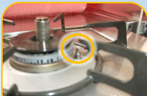
立ち消え防止装置

コンロ上部の部品は取り外せません。赤い火が出たときは、バーナーキャップの細かい溝などを掃除すると良いかも知れません。掃除の際は、手袋をはめ、ガス栓を閉め、安全に気を付けて行ってください。掃除後は、バーナーキャップを乾かしてから、元の位置にしっかりとめ込んでください。