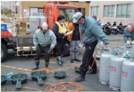
避難所で利用されるLPガス