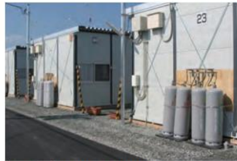
仮設住宅に設置されたLPガス