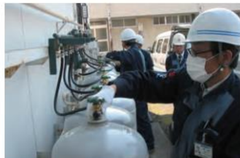
避難所（埼玉県加須市）に供給設備を設置