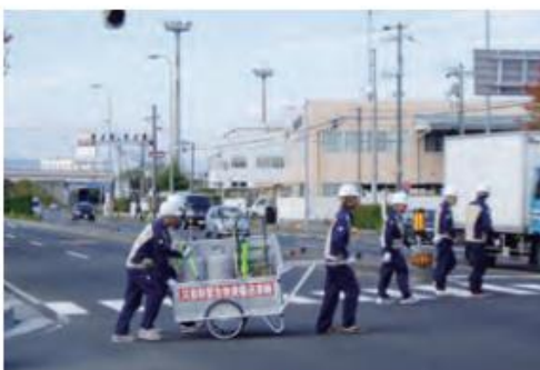
リアカーで容器を運搬 (写真は訓練時のものです)