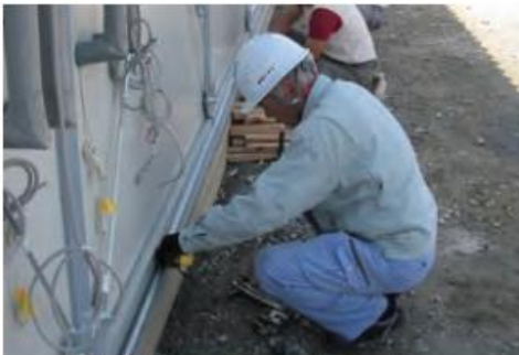
仮設住宅（南相馬市）での供給設備設置工事